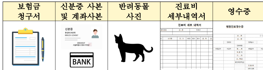
펫보험 의료비 보험금 청구 서류(예시)*

* 주요 보험사의 펫보험 청구서류로 실제 청구하는 보험금 종류, 회사에 따라 다를 수 있음