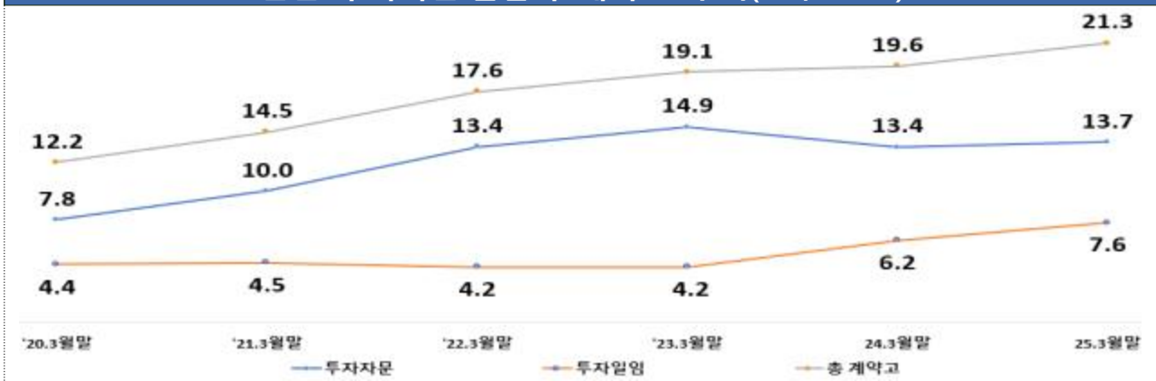
전업 투자자문·일임사 계약고 추이(단위 : 조원)