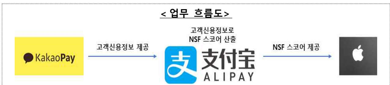
< 업무 흐름도 >